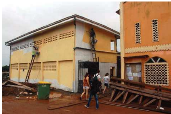
Arrivée des jeunes à l'école ; derniers coups de pinceaux