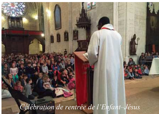
Célébration de rentrée de l'Enfant-Jésus

Le 14 septembre, jour de la fête de la Croix glorieuse, les enfants de l'école et du collège de l'Enfant Jésus se sont rassemblés dans la collégiale de La Roche-foucauld pour leur célébration de rentrée. Pour commencer, tous ont fait le signe de croix avec respect, avant d'écouter la Parole de Dieu proclamée et commentée par le Père Armand : « être chrétien, c'est suivre les commandements d'amour de Dieu. Ce début d'année est l'occasion de choisir des efforts à faire pour mieux vivre selon l'esprit de l'Évangile car être chrétien, c'est du concret ! »