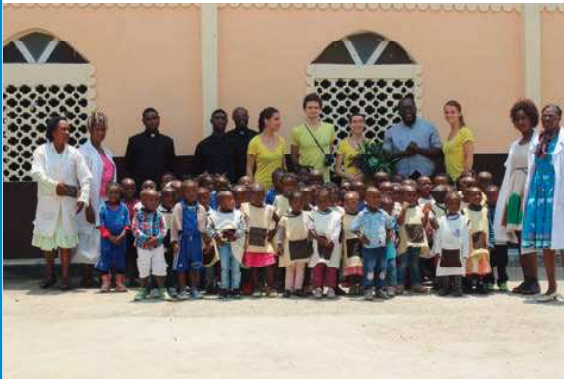
Jour de l'inauguration