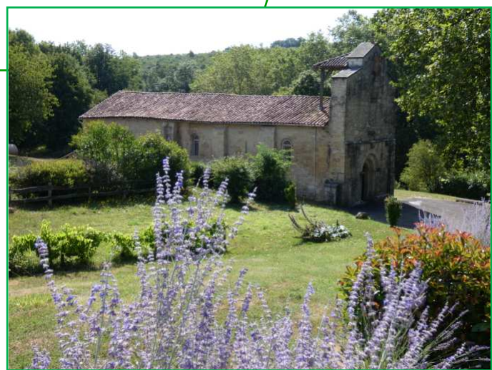
Église Saint-Maixent de Saint-Adjutory