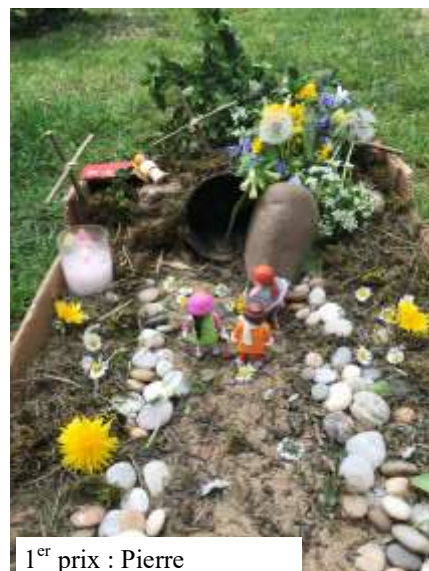
1 er prix : Pierre

Les jardins de Pâques pérennes seront exposés, afin de partager ce beau moment avec les paroissiens qui le souhaitent !