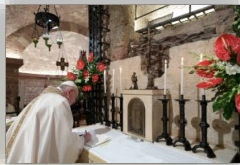
Signature de l'encyclique Fratelli tutti par le pape François sur le tombeau de Saint François d'Assise le 3 octobre 2020

Le 3 octobre dernier, veille de la fête de Saint François, le pape François a signé à Assise sa troisième encyclique intitulée "Fratelli Tutti", expression en italien tirée d'un écrit du Saint qui s'adressait « à tous ses frères et sœurs, pour leur proposer un mode de vie au goût de l'Évangile ». C'est d'une « fraternité ouverte qui permet de reconnaître, de valoriser et d'aimer chaque personne... » dont va nous entretenir le Pape dans cette encyclique. Voici quelques extraits.