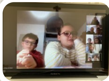
Le catéchisme en visio