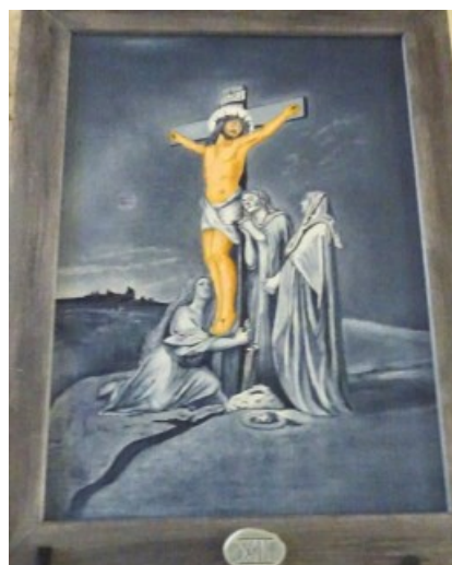
XII e Station Eglise de Malleyrand