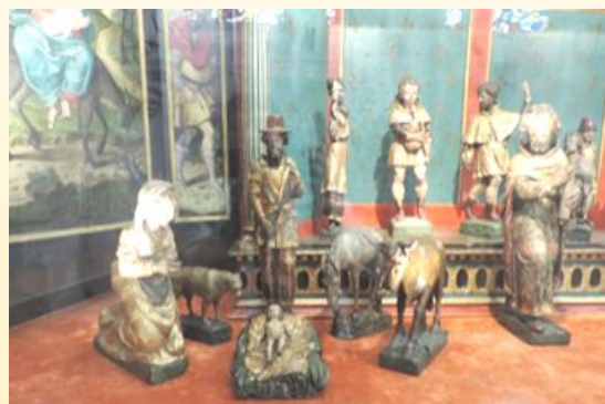
Crèche de Chaource datant de 1540

Le symbolisme de la crèche ou de la grotte est un rappel du dépouillement et de l'humble cadre du lieu de naissance du Christ, venu pour nous sauver et nous inviter à « nous dépouiller » nous aussi.