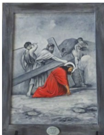
V e Station Eglise de Malleyrand