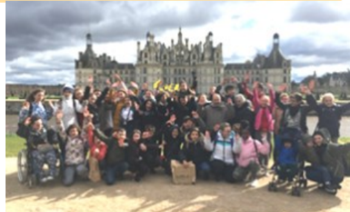
Photo Pèlerinage 2020 Chambord

Veuillez noter les dates du Pèlerinage des collégiens du 8 au 12 février 2021 . Nous ne sommes pas en mesure de vous donner plus amples informations. Elles vous seront communiquées ultérieurement.