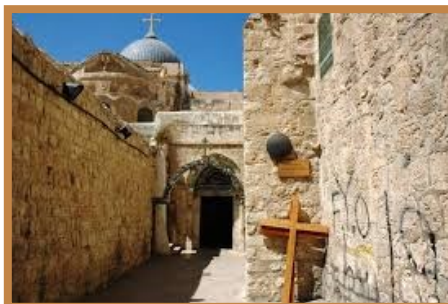
Via dolorosa à Jérusalem