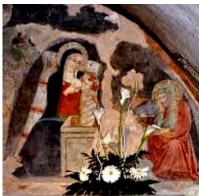
Fresque de la nativité Eglise de Greccio, Italie, XVe