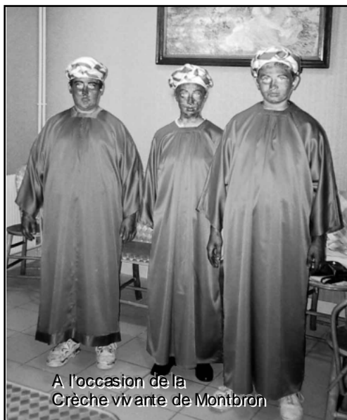
A l'occasion de la Crèche vivante de Montbron

- 7 janvier : c'est l'Épiphanie ! Mais là, cela ne relève pas des recherches historiques du chroniqueur mais des enseignements (doctes) de nos bons pères !