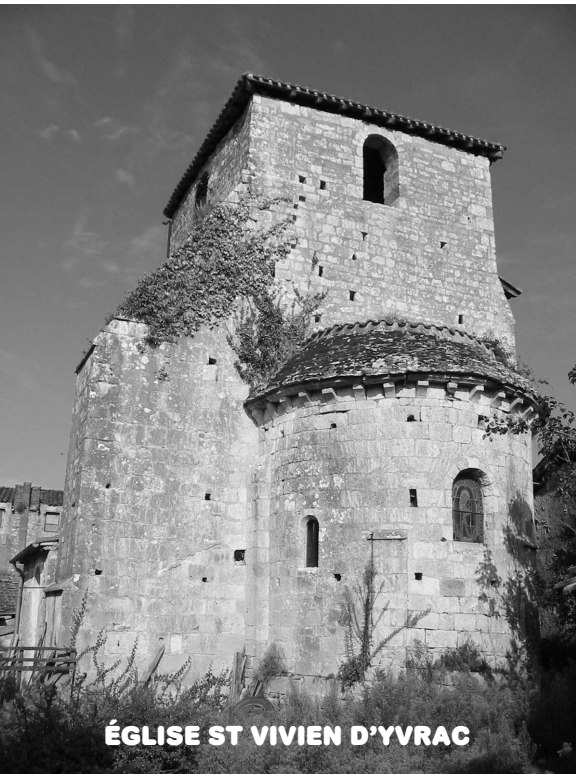
ÉGLISE ST VIVIEN D'YVRAC

difficulté ne provient pas de l'absence de sources, mais de leur diversité. C'est pour-quoi il faut se réjouir qu'à l'occasion de cette fête les rapports extrêmement cordiaux entre nos prêtres, la communauté et les représentants de la Saint Patrick ne font que se développer harmonieusement.