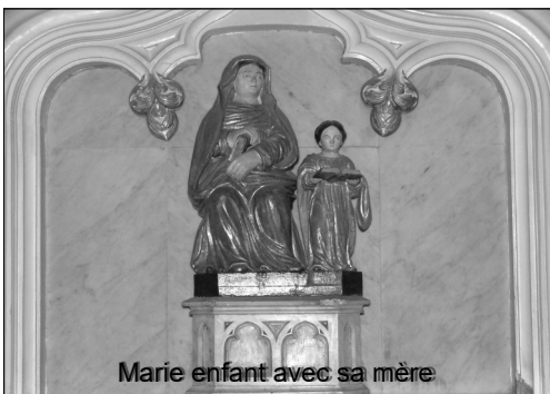
Marie enfant avec sa mère

- 8 Septembre : Nativité : Fête anniversaire qui nécessite un complément d'enquête auprès de nos pères ! 1429 : échec de Jeanne d'Arc devant Paris. En 1760, tristesse : la capitulation de Montréal marque la perte du Canada qui passe entièrement sous le contrôle des Anglais.