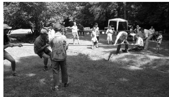
* Les papas tirent sur une corde