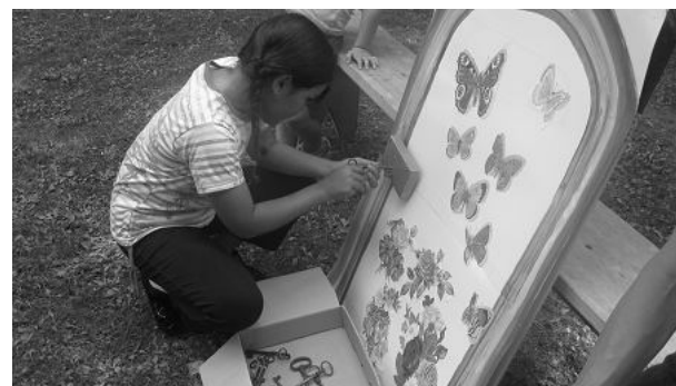
* finalement tout le monde s'y met et la bonne clef est retrouvée!