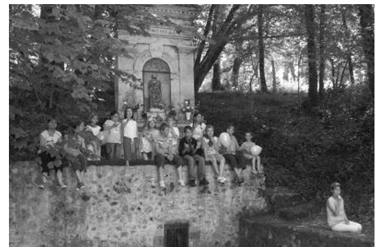
* ce sont les parents qui jouent et les enfants qui regardent !!!