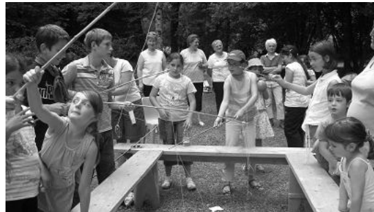
* Saint Pierre a perdu les clefs du para-

Après le pique nique tiré des sacs, les bizarreries continuent: