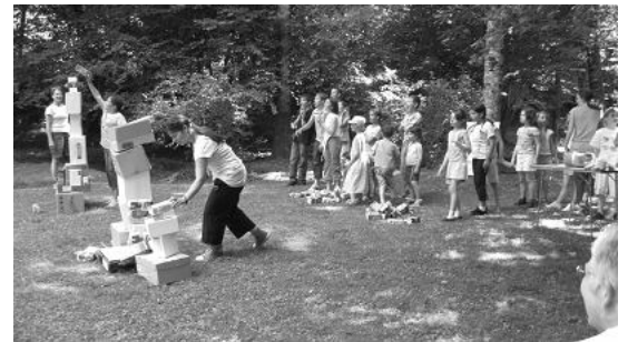
* l'église que les enfants bâtissent a des airs penchés, et saint Pierre cherche toujours ses clefs!