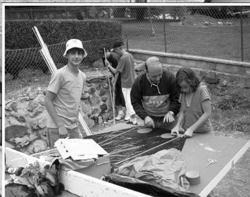
A construire ensemble...