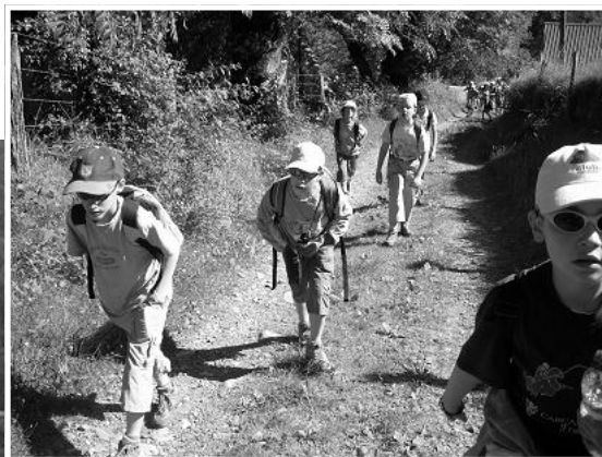
A persévérer... Quand il faut avancer malgré la fatigue...