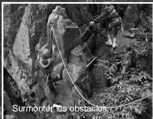
Surmonter les obstacles...