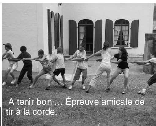
A tenir bon ... Épreuve amicale de tir à la corde.

C'est à Gripp , dans le chalet de Montbron Pyrénées que s'est déroulé le camp d'été pour les jeunes de nos paroisses: il restera dans les mémoires et dans les cœurs comme un souvenir joyeux, une expérience unique, une étape privilégiée.. .L'école est loin, la famille aussi, mais pourtant que d'enseignements !!!