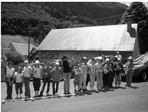
A être patient , tout d'abord... Ici ce sont les coureurs du tour de France qui se font attendre...