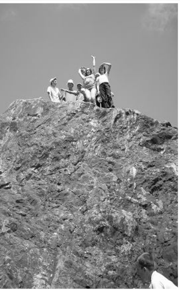
Atteindre des sommets..