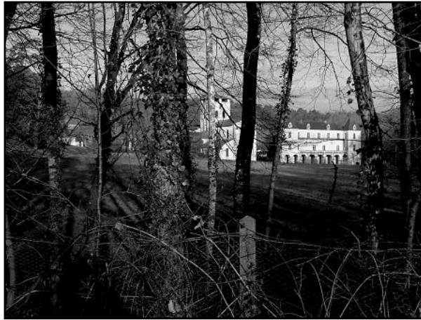
Abbatiale et logis de l'Abbé à Chancellade

Enfin, n'oubliez pas de réserver le Dimanche 9 Novembre pour le repas de la fraternité à Saint Projet.