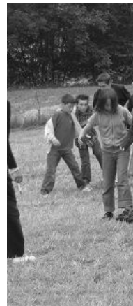
A vivre ense