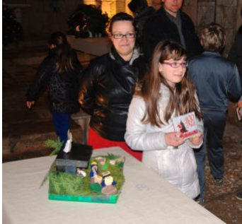
La jeune gagnante du concours

A l'église Saint Paul, à Chazelles, s'est déroulé un concours de crèches juste avant Noël. L'association « les chats huant », qui œuvre pour la mise en valeur de cette belle église, a organisé ce moment sympathique, en préparant l'église et en offrant un espace à chaque exposant. Les œuvres étaient très variées, mais pour la plupart faites main pour l'occasion de ce deuxième concours, deux ans après le premier. Les participants ont rivalisé d'imagination dans les matières utilisées et les techniques. Les ciseaux, la colle, le carton et le bois ont fait merveille dans les mains des créateurs.